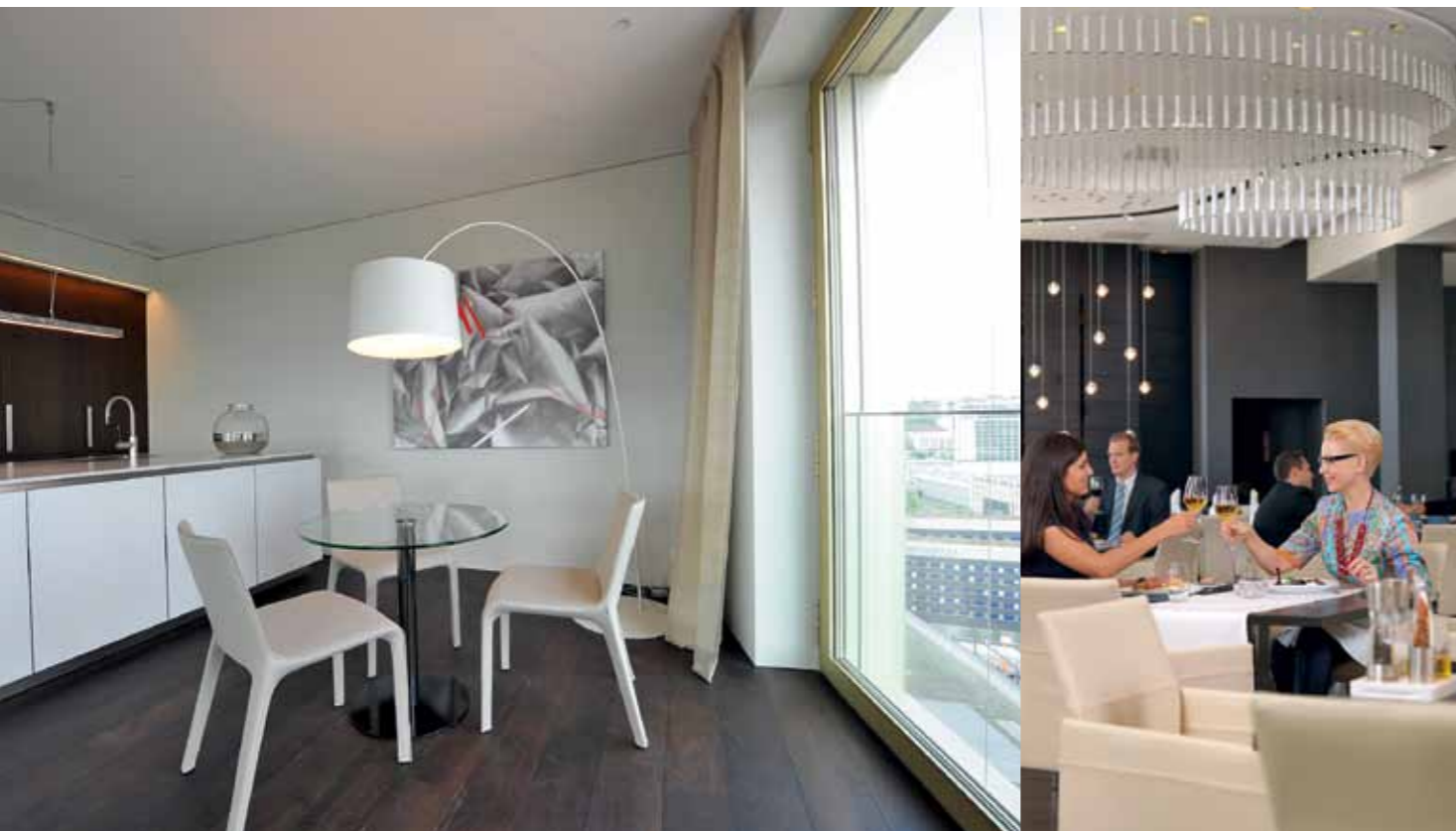
Selber kochen, sich Häppchen bringen lassen oder einen Abend mit Freunden im «Equinox» verbringen, dem Restaurant im Haus? Den Bewohnern im Mobimo Tower stehen der Rundum-Service und die Infrastruktur des Hotels direkt unter ihnen zur Verfügung.