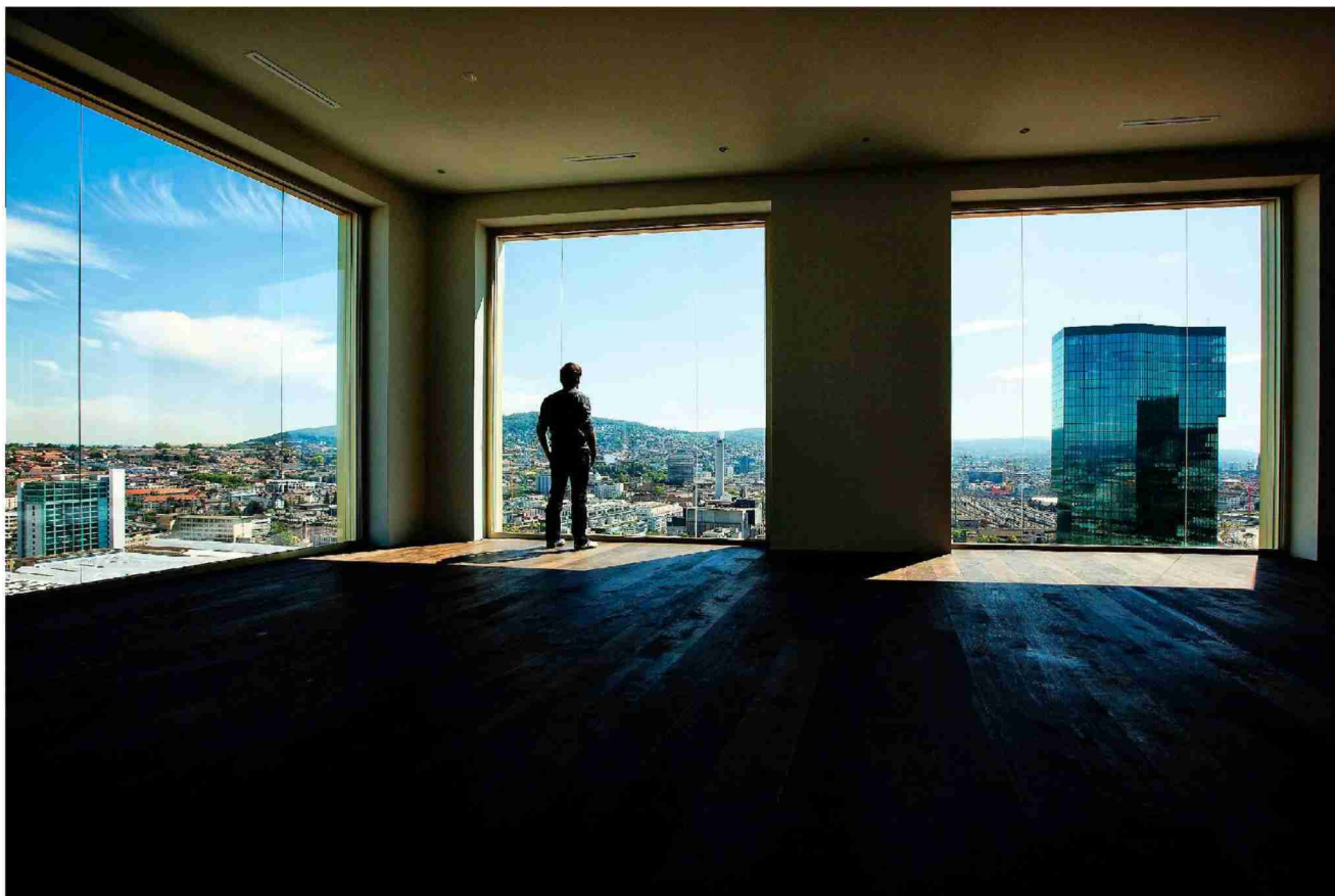
Der Blick aus der Eigentumswohnung im obersten Stock des Mobimo Tower. Im Fenster rechts der benachbarte Prime Tower.

Themen-Nr.: 571.6 Abo-Nr.: 571006 Seite: 13 Fläche: 83'004 mm 2