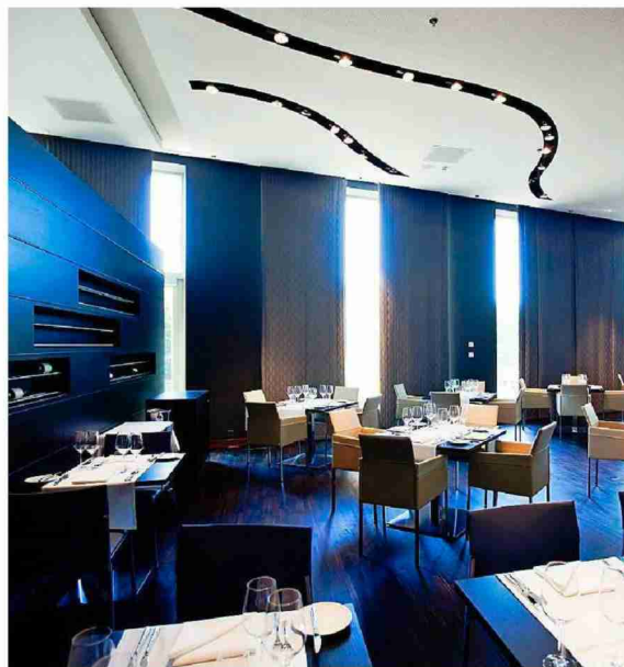
Im Restaurant Equinox speisen die Hotelgäste.

Themen-Nr.: 571.6 Abo-Nr.: 571006 Seite: 13 Fläche: 83'004 mm 2